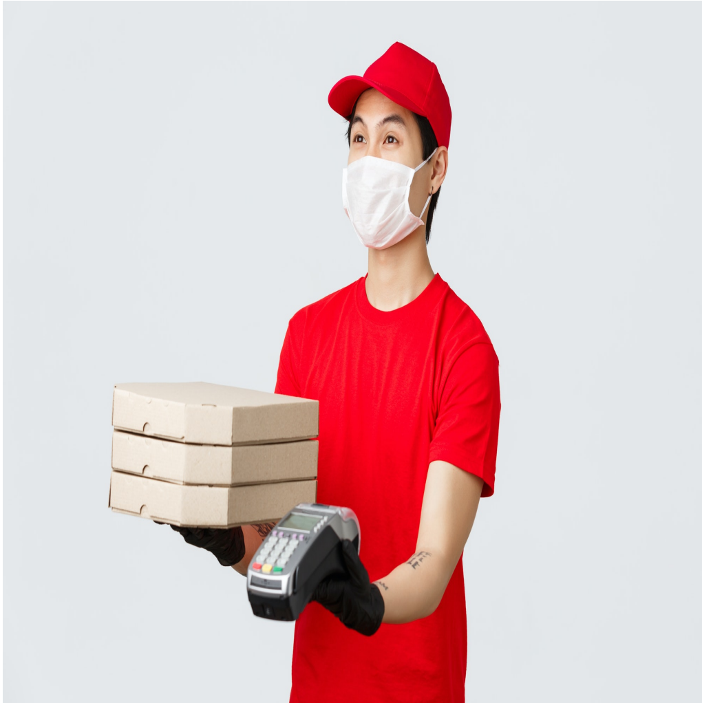
Livreur en temps de contagion