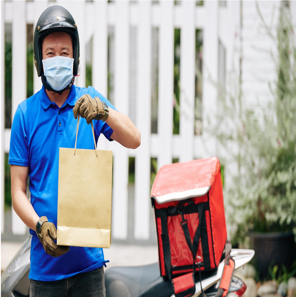
Livraison des commandes

Fourneaux cachés (Kitchen Ghost – Dark Kitchen, Uber Eats© & Co ) & BIENS COMMUNS. Ou comment concilier modernité et efficacité individuelle et collective en prenant un temps d'avance sur les évolutions sociétales !