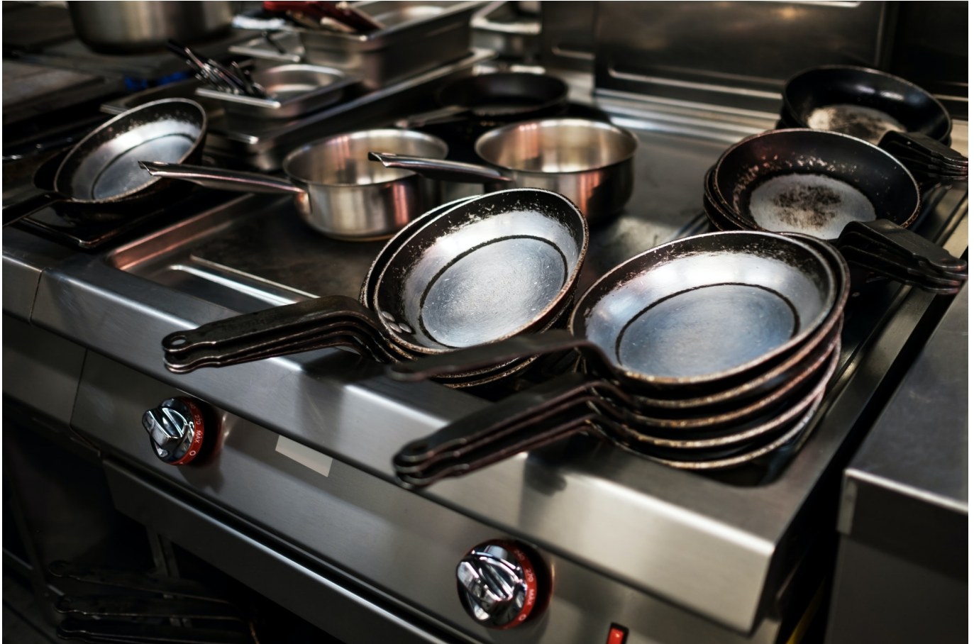
Une Cantina en attente d'être sous le feu.

Fourneaux cachés (Kitchen Ghost - Dark Kitchen, Uber Eats© & Co ) & BIENS COMMUNS. Ou comment concilier modernité et efficacité individuelle et collective en prenant un temps d'avance sur les évolutions sociétales !