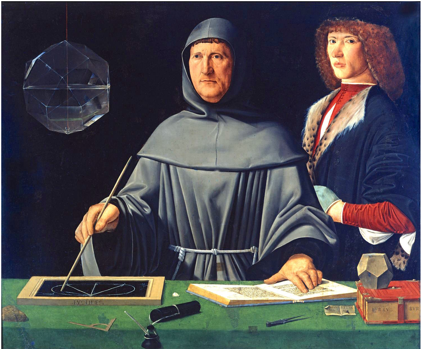
Attributed to Jacopo de' Barbari

Cet enregistrement se fait sous le contrôle de l'État (Organisme public ou assimilé) ou directement par l'État (ministère de l'Économie par exemple). Il a pour mission, comme pour le Grand Livre d'une comptabilité d'Entreprise, d'enregistrer l'ensemble des mouvements financiers survenant à l'intérieur de l'État. L'inscription se fera sous la notion comptable dite de double écriture avec la fameuse notion de crédit et débit pour identifier les ressources utilisées et l'usage des ressources.