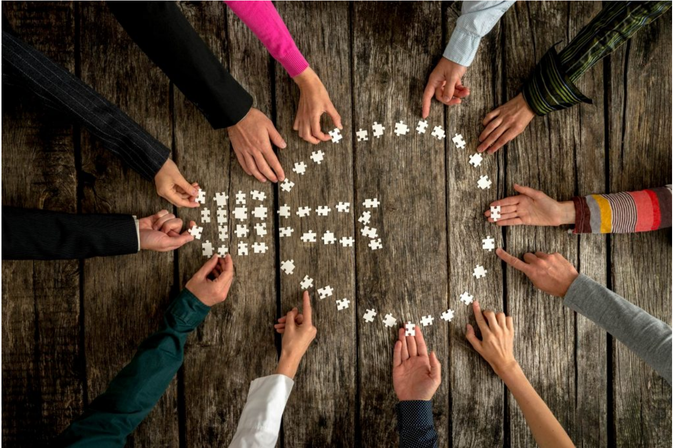
Travail d'équipe